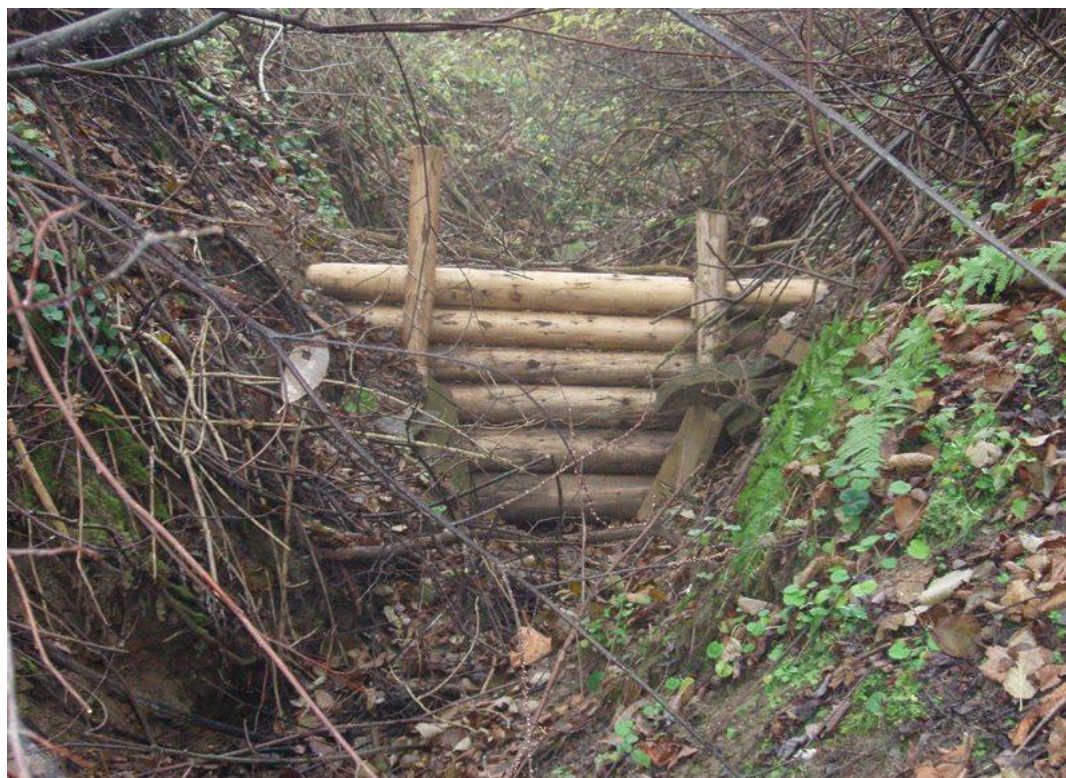
Obr. č. 2 Protipovodňové hrádze