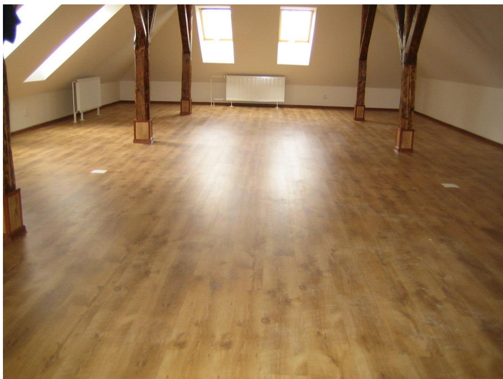
Obr. č. 3 Vybavenie Sociocentra