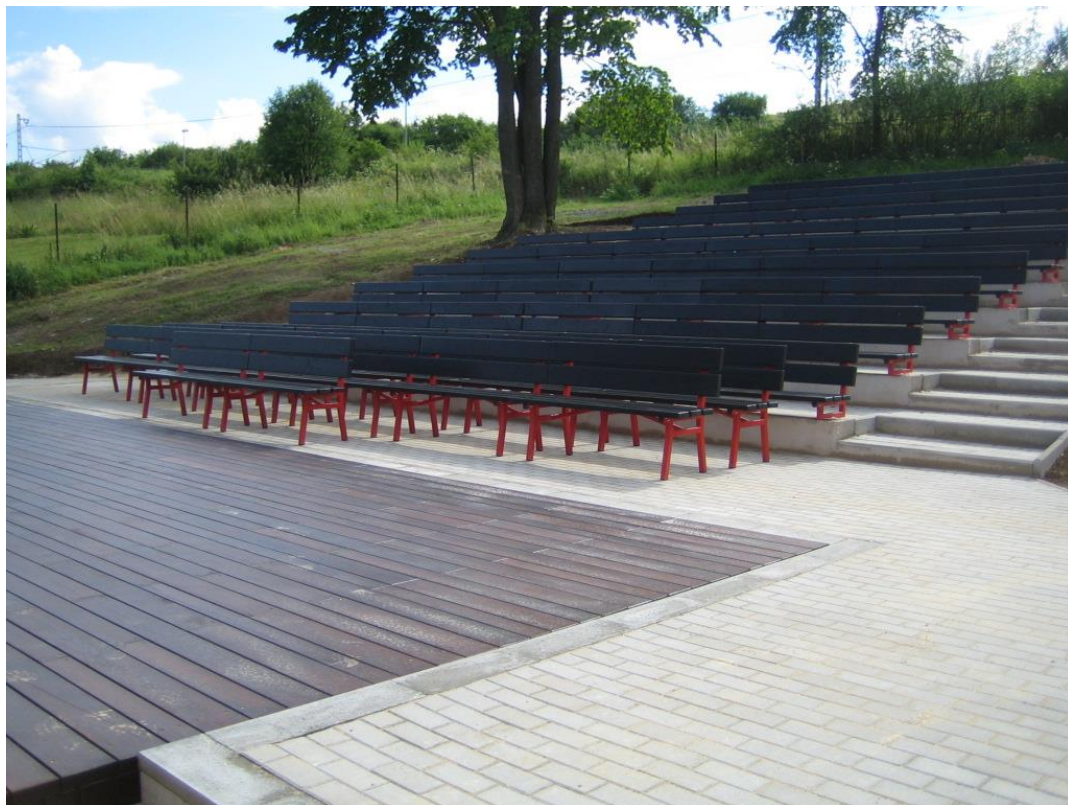
Obr. č. 1 Amfiteáter za Polyfunkčným centrom